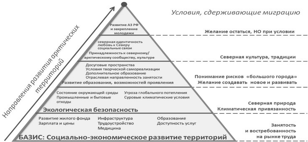
Рис. 2. Направления развития территорий АЗ РФ, исходя из потребностей местной и приехавшей студенческой молодёжи

Fig. 2. Points of development of the Arctic territories, based on the needs of local and visiting students