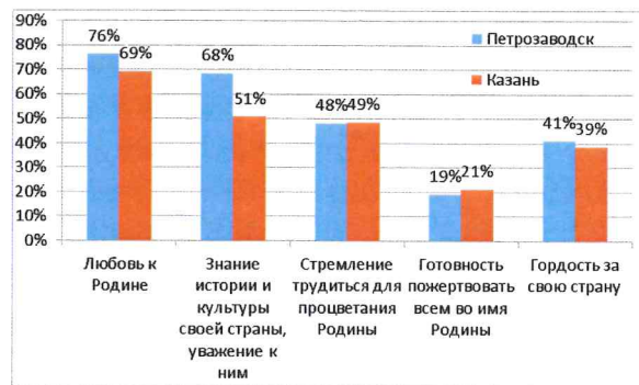
Рисунок 3. Что значит патриотизм лично для Вас?