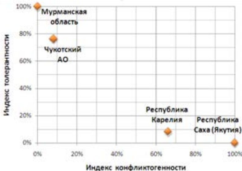
Рисунок 3. Индекс конфликтности и Индекс толерантности субъектов Арктики по оценкам принимающего населения

Исследование показало, что с точки зрения межнациональных отношений в субъектах Арктической зоны России всё относительно спокойно. Результаты проекта нашли большой отклик в регионах Арктики. Результаты опросов трудовых мигрантов вызвали большой интерес в исследуемых субъектах и были направлены в региональные органы власти для ознакомления. Не вызывает сомнения, что исследования, связанные с этой тематикой, играют важную превентивную роль, и должны обязательно развиваться.