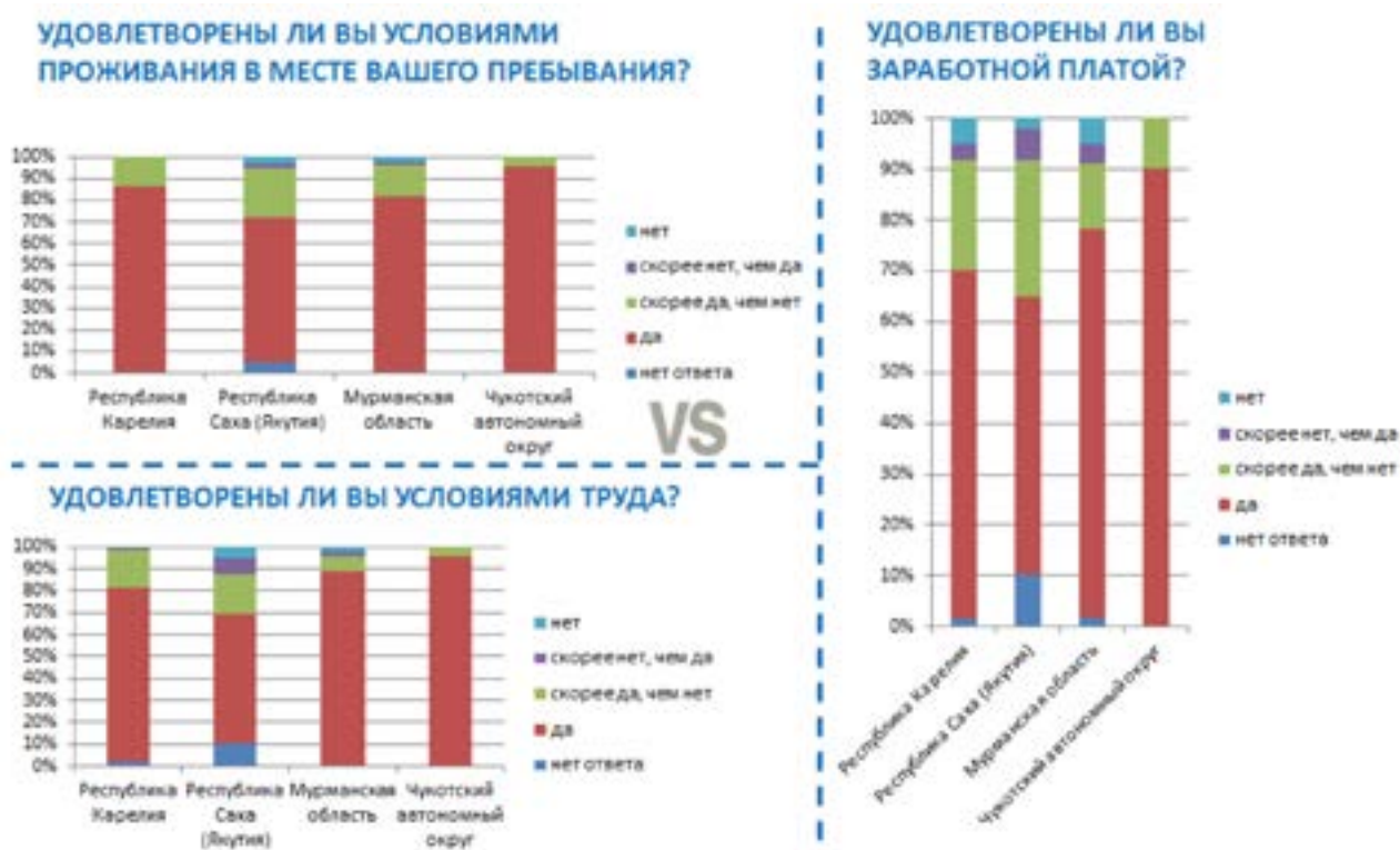
Рисунок 1. Качество жизни трудового мигранта в Арктике

Зарубежный трудовой мигрант на региональном рынке труда в Арктике представляет особенный интерес. Как следует из рисунка 2, в три обследуемых субъекта (Республика Каре-