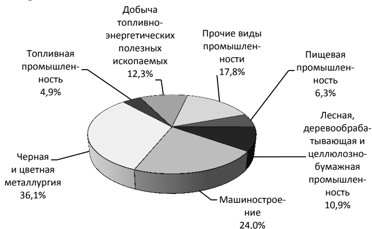
Рис. 1. Отраслевая структура монопрофильных территорий, 2013 г.

Анализ отраслевой структуры монопрофильных территорий по состоянию на 2013 г. показал, что большая часть моногородов относится к монопрофильным поселениям, в которых расположены крупные предприятия черной и цветной металлургии (36,1% от общего количества), машиностроения (24,0%), топливно-энергетических полезных ископаемых (12,3%), лесной и деревообрабатывающей промышленности (10,9%), пищевой промышленности (6,3%) и топливной промышленности (4,9%). Оставшаяся часть – 17,8% моногородов – распределена по ряду других отраслей (рис. 1).