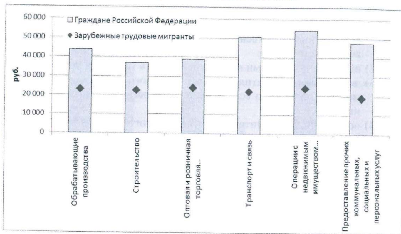
Рис 1. Сопоставление среднемесячной номинальной начисленной заработной платы зарубежных трудовых мигрантов и российских граждан по основным ВЭД в г. Москве 1 , 2012 г.

Рассмотрим размеры среднемесячной номинальной начисленной заработной платы зарубежных трудовых мигрантов и российских граждан в разрезе основных видов экономической деятельности.