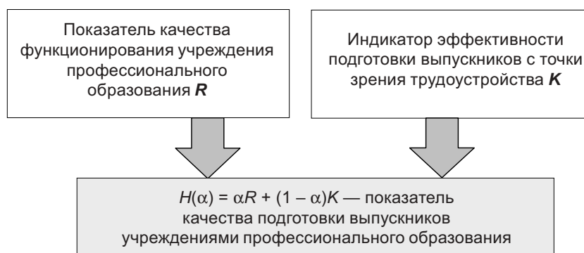
Рис. 1. Концептуальная модель расчета итогового показателя качества подготовки выпускников учреждениями профессионального образования

• Традиционные показатели оценки качества подготовки сводятся к оценке нормы процесса обучения и не затрагивают его итоговый результат — трудоустройство. Также они не учитывают основные характеристики состояния рынка труда — спрос на выпускников по данной специальности и условия принятия их на работу (уровень зарплаты и время, в течение которого выпускник работал на первом рабочем месте). Наряду с показателями, используемыми в существующих методиках (балл ЕГЭ абитуриентов и другие традиционные показатели), авторы предлагают учитывать целый спектр новых показателей : дополнительный спрос и дополнительное предложение на рынке труда, процент трудоустройства по специальности; годовая заработная плата первого года работы выпускника; закрепляемость выпускников на рабочем месте; продолжительность работы выпускника по специальности.