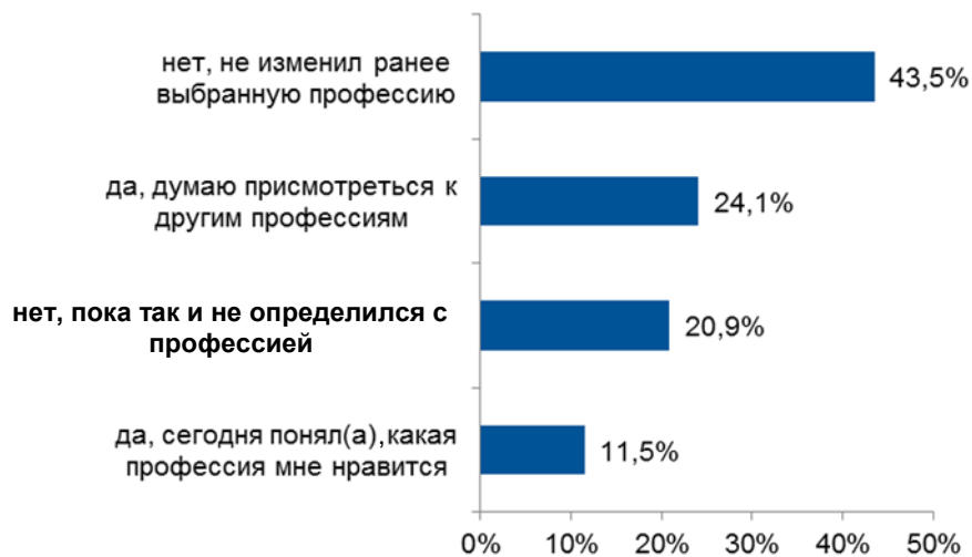
Рис. 6. Распределение ответов обучающихся на вопрос «После знакомства с информацией на портале изменилось ли твое решение о будущей профессии?», в % от численности опрошенных

По итогам профориентационного урока 11,5 % обучающихся поняли, какая профессия им нравится, также почти каждый четвертый (24,1 %) решил присмотреться к другим профессиям (рис. 6). Таким образом, удельный вес школьников, уже сделавших выбор профессии в начале урока, составил 46 %, а удельный вес школьников, определившихся с потенциальной профессией по окончании урока, 86 %.