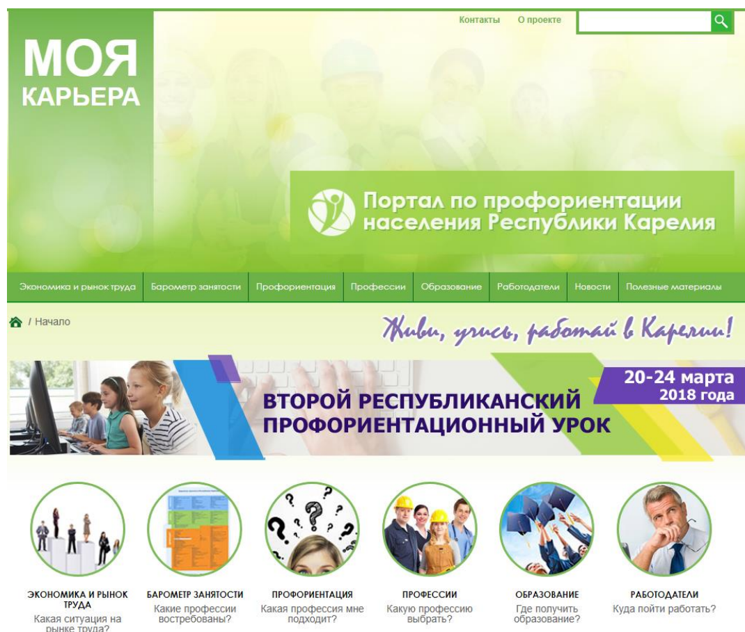
Рис. 1. Главная страница профориентационного интернет-портала «Моя карьера»

Интернет-портал «Моя карьера» (адрес доступа: http://mycareer.karelia.ru/ ) представляет собой дидактический, технический, познавательный комплекс с продуманной навигацией для непрерывного сопровождения профессионального самоопределения граждан с использованием Интернета (рис. 1).