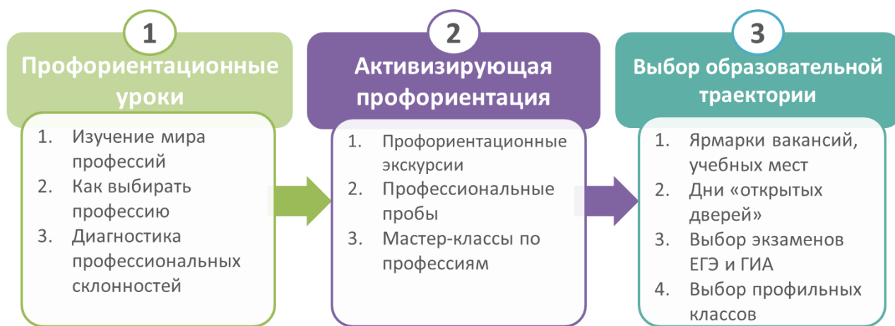
Рис. 2. Место профориентационного урока в профессиональной ориентации обучающихся общеобразовательных организаций

Второй этап представляет собой активизирующую профориентацию, в ходе которой обучающиеся могут попробовать себя в понравившихся профессиях; познакомиться с носителями профессий; увидеть рабочее место. На данном этапе происходит анализ выбранной профессии; углубление знаний о будущей профессии; знакомство со спецификой профессий в экономике родного региона.