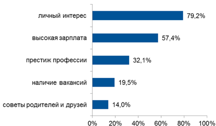
Рис. 5. Факторы выбора обучающимися профессии

Большинство школьников, а именно 80 %, при выборе профессии руководствуются личным интересом к ней, к содержанию работы, т. е. ориентируются на личные склонности и предпочтения в профессиональной сфере (рис. 5). Каждый второй обучающийся также обращает внимание на уровень зарплаты на рынке труда по профессии. При этом востребованность профессии на рынке труда для некоторых играет существенную роль, следовательно, при профориентации школьников необходимо акцентировать их внимание на этом факторе выбора профессии. Это позволит учесть все три компонента профессионального выбора: «хочу», «могу» и «надо».