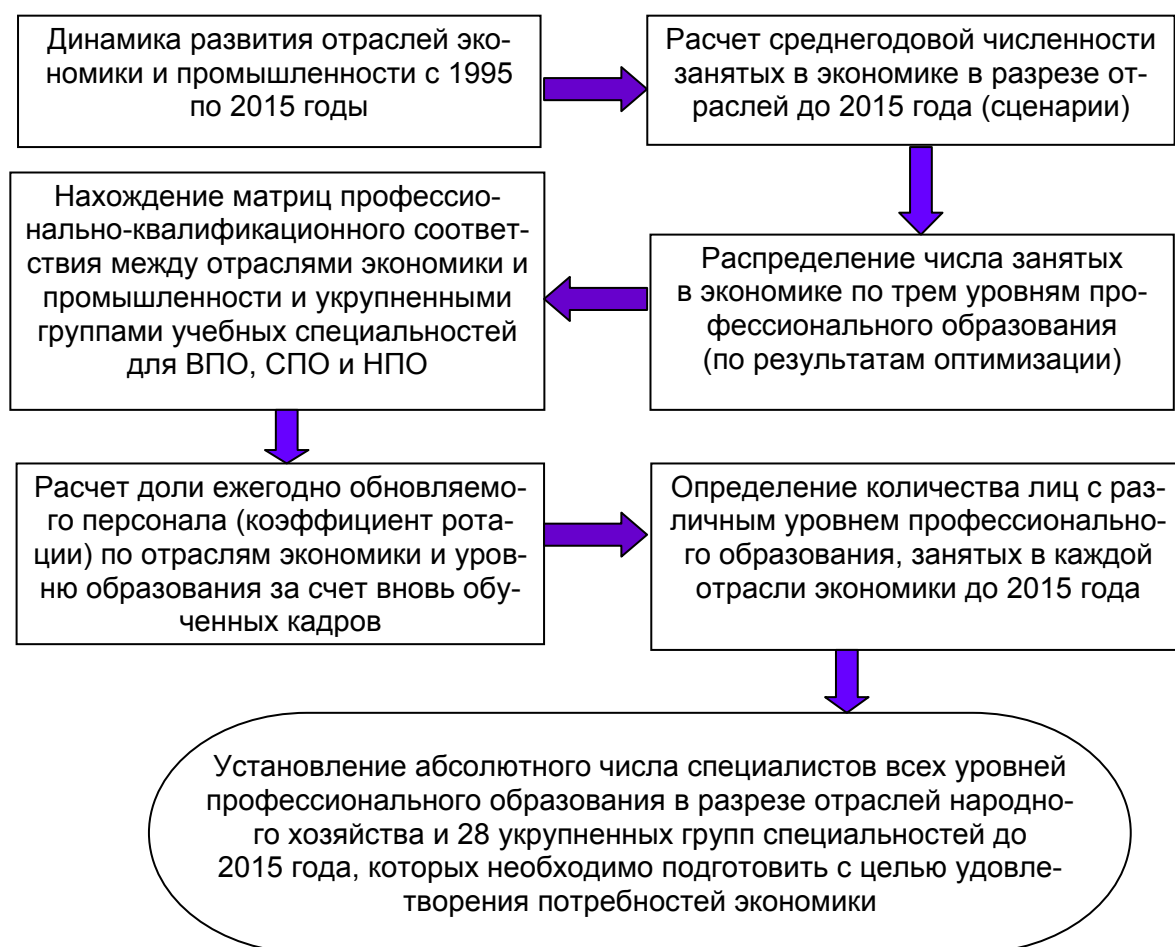
Рис. 2. Концептуальная схема методики прогнозирования потребности региональной экономики в специалистах с различным уровнем профессионального образования

Концептуальная схема методики прогнозирования потребности региональной экономики в специалистах с различным уровнем профессионального образования приведена на рисунке 2. Начальным этапом получения суммарной потребности для каждой отрасли в конкретном регионе является статистика динамики развития отраслей экономики, структуры занятости трудовых ресурсов в отраслях экономики, а также уровня профессионального образования кадров в регионе и в отрасли.