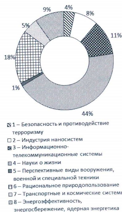
Рис. 1. Доли приоритетных направлений среди «самоотнесенных» кандидатских диссертационных исследований в 2011–2014 гг.

Наибольшее количество из числа «самоотнесенных» диссертационных исследований из года в год относится к приоритетному направлению «4 — Науки о жизни», на втором месте находится «Рациональное природопользование», на третьем — «Информационно-телекоммуникационные системы» (рис. 1).