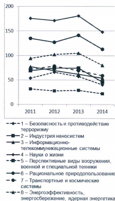
Рис. 2. Количество специальностей «самоотнесенных» кандидатских диссертаций за период 2011–2014 гг.

приоритетному направлению был достаточно широкий и охватывал специальности, научные исследования по которым заведомо не могли быть отнесены к приоритетному направлению. Например, по приоритетному направлению «1 — Безопасность и противодействие терроризму» наибольшее количество диссертационных исследований относилось к группам специальностей научных работников «12.00.00 Юридические науки» и «23.00.00 Политология» (научные специальности «23.00.02 Политические институты, процессы и технологии», «12.00.09 Уголовный процесс», «12.00.08 Уголовное право и криминология; уголовно-исполнительное право»). Для приоритетного направления «7 — Транспортные и космические системы» на первом месте по количеству диссертаций научная специальность «08.00.05 Экономика и управление народным хозяйством (по отраслям и сферам деятельности)». Что, конечно, не соответствует содержанию приоритетных направлений.