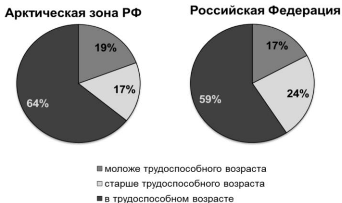
Рис. 2. Распределение населения Арктической зоны РФ по возрасту в сравнении с РФ в целом (на 1 января 2014 г.)

При этом в Арктике преобладает более молодое население по сравнению с РФ (рис. 2). Предположительно это связано с тем, что лица пенсионного возраста после окончания трудовой деятельности покидают территории, отнесенные к Арктической зоне, и переезжают в места с более благоприятными природно-климатическими условиями.