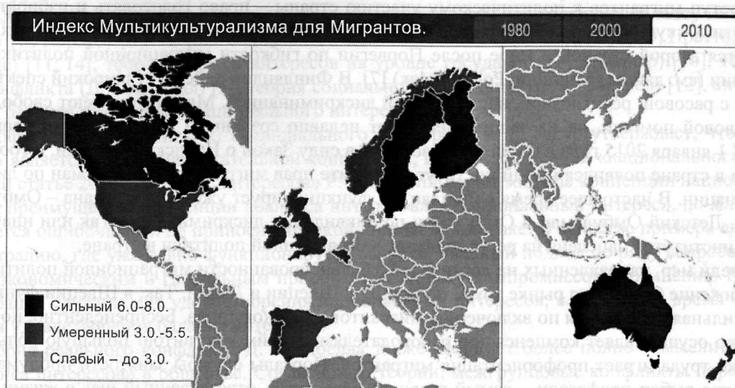
Рис. 2. Индекс мультикультурализма для мигрантов в 2010 г.

Таким образом, если государство пытается реализовать указанные выше восемь критериев, то баланс интересов в миграционной политике становится достижимым. В 2010 г. наиболее сильный Индекс мультикультурализма был зафиксирован в Канаде (7.5), Швеции (7), Финляндии (6), Великобритании (5.5).