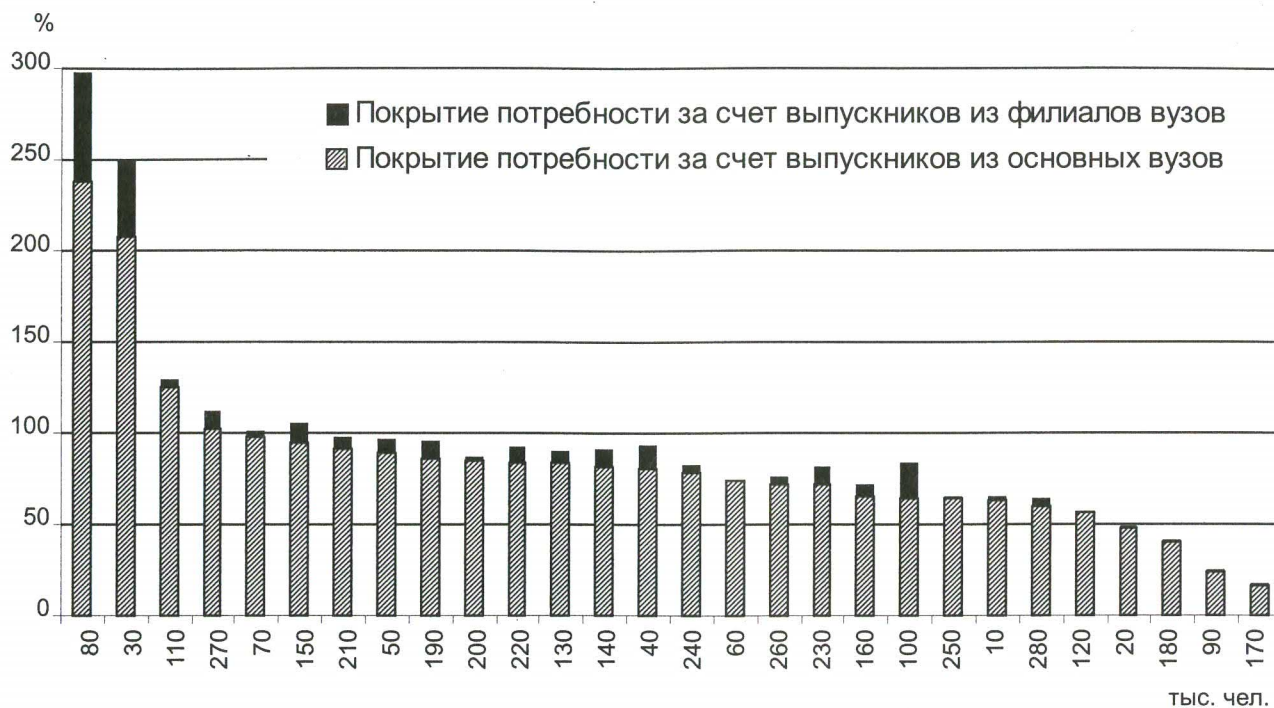
Рис. 2. Удовлетворение потребности экономики РФ в кадрах с высшим профессиональным образованием за счет выпускников очной формы обучения основных вузов и их филиалов, 2010 г.

рованных кадров по таким УГС, как «100000 Сфера обслуживания», «040000 Социальные науки», «150000 Metallургия, машиностроение и металлообработка», «230000 Информатика и вычислительная техника» и «190000 Транспортные средства». По указанным УГС выпускники филиалов вузов могут обеспечить удовлетворение потребности в кадрах от 10 до 21 %.